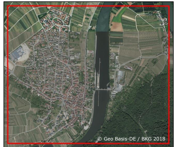
Abb. 2: Projektgebiet – Schleusenanlage Hessigheim / Neckar mit erweitertem Bauwerksumfeld

Die bisherigen PSInSAR-Analysen fokussierten sich auf TerraSAR-X-Daten. Auf der Basis von 33 SAR-Bildern konnten Höhenveränderungen pro Jahr erfasst werden. Die Ergebnisse sind in den weiteren Arbeitsschritten denen aus den Sentinel-1-Daten gegenüberzustellen. Final werden neben neuen wissenschaftlichen Erkenntnissen und optimierten Prozessierungsalgorithmen auch anwendungsorientierte Datenprodukte mit den erfassten und bewerteten räumlichen Veränderungen, Aussagen zur grundsätzlichen Machbarkeit und Umsetzungsvorschlägen für einen Monitoring-wirkbetrieb erwartet.